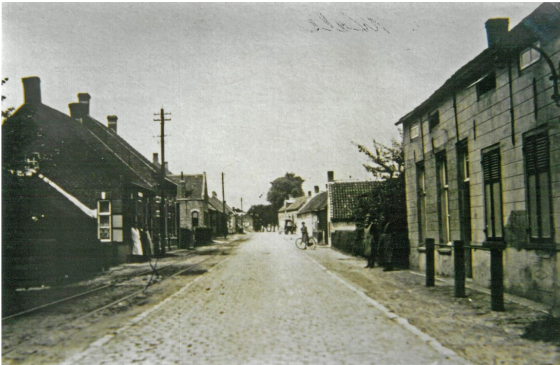
Kuitaart richting Kloosterzande